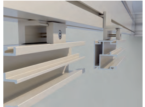
Aussenbündige oder eingerückte Montagemöglichkeit