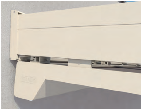
Klare Linienführung im Übergang Kasten zu Ausfallprofil