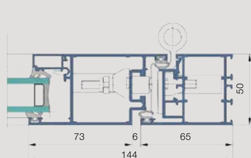
Tür US-2: Horizontalschnitt mit Rollenbändern