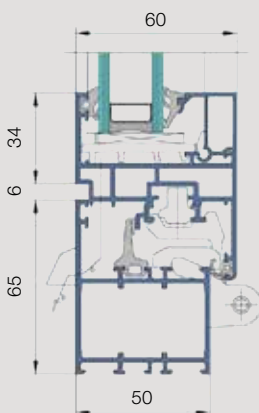
Fenster US-2: Vertikalschnitt